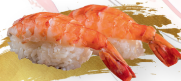
S27. EBI b | 4.90 € Garnelen - prawn