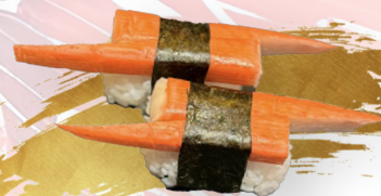
S25. SURIMI NIGIRI f | 4.90 € Krebsfleisch - crab stick