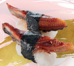
S22. UNAGI d | 4.90 € Süßwasseraal - sweetwater eel