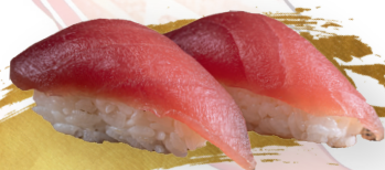
S24. MAGURO NIGIRI c | 4.90 € Thunfisch - tuna