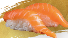
S23. SAKE d | 4.90 € Lachs - salmon